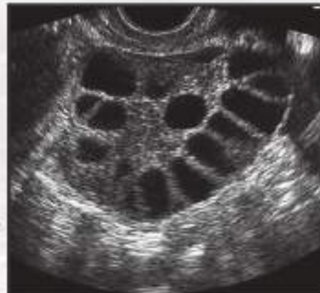
Cysts In Ovaries