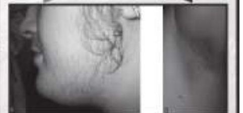
Excessive Hair Growth